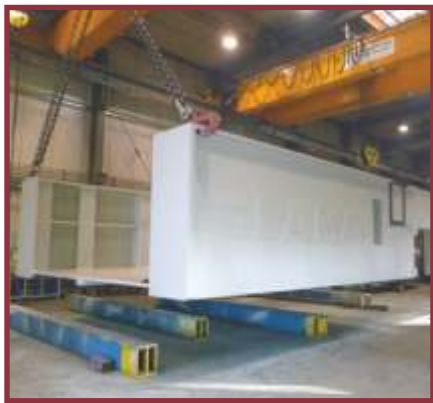
Maschinenrahmen für Schmiedemanipulator, 85 to