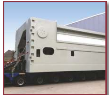
Maschinenständer, 150 to